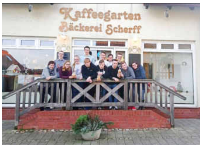
Der Elternrat und die Kinder der 9. Klasse